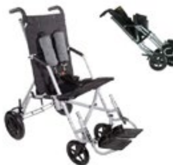
Código 570-003-32-1 ancho de asiento 30 Cm. 570-003-32-4 ancho de asiento 35 Cm. 570-003-33-1 ancho de asiento 40 Cm. 570-003-33-4 ancho de asiento 45 Cm.