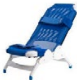
Silla de Baño básica

Los indicadores rojos muestran los puntos de ajustes angulares en el asiento y el espaldar. Los ajustes se pueden hacer con el paciente en la silla y permiten que la silla se pueda plegar según sea el caso. El respaldo y asiento pueden cambiar de ángulos: 0, 22, 45, 67 y 90 grados.