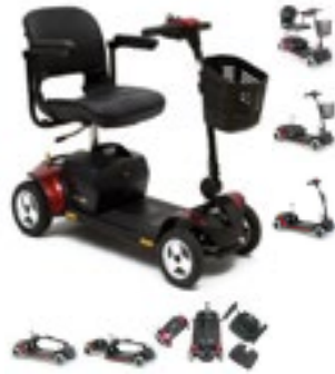
Scooters de 4 Ruedas Go-Go Elite Traveler