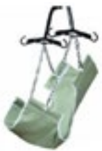
Lona Asiento de Algodón para Grúa Hidráulica Código GF112C-C