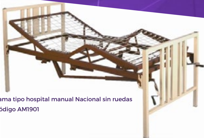
Cama tipo hospital manual Nacional sin ruedas Código AM1901