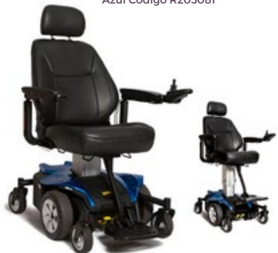
Código Jazzy Air