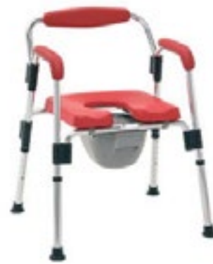
Modelo R203036 Rojo