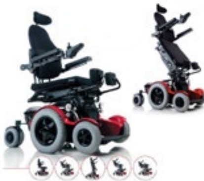
Código Levo C3