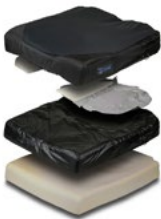
Cojín Jay Xtreme