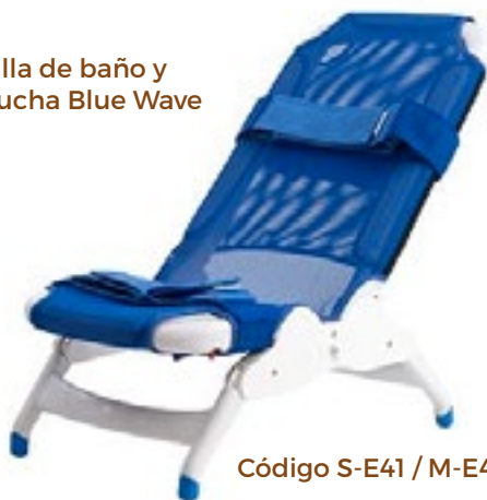
Código S-E41 / M-E42 / L-E43