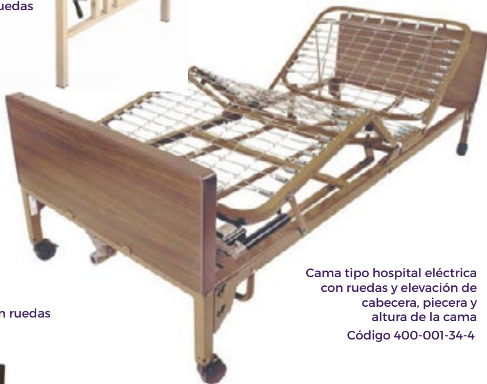
Cama tipo hospital eléctrica con ruedas y elevación de cabecera, piecera y altura de la cama Código 400-001-34-4