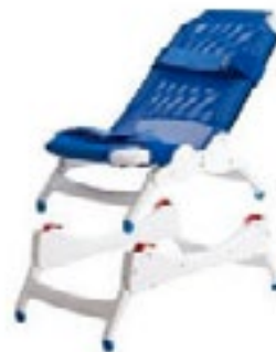
Soporte para Tina

La silla básica del baño Blue Wave está disponible en tres tamaños: pequeño (E541), mediano (E542) y grande (E543). En cada uno de estos tamaños se pueden utilizar en combinación con los soportes para tina y/o baño.