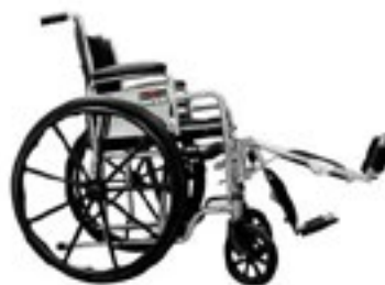
Con elevapierna Código 24040140