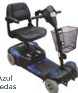
Color Azul de 4 Ruedas