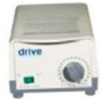
Motor con regulador de inflación