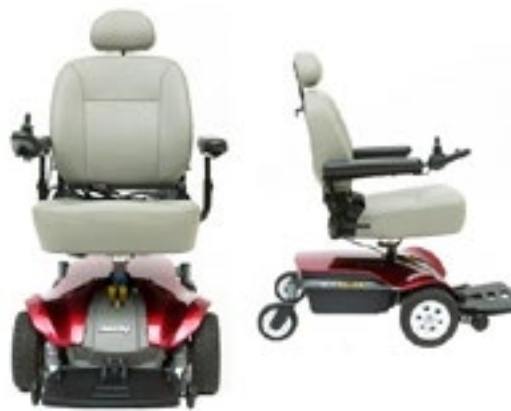
Código JAZZY Select Elite