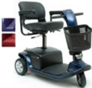
Código 3 ruedas SC609