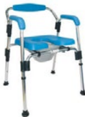
Modelo R203038 Azul