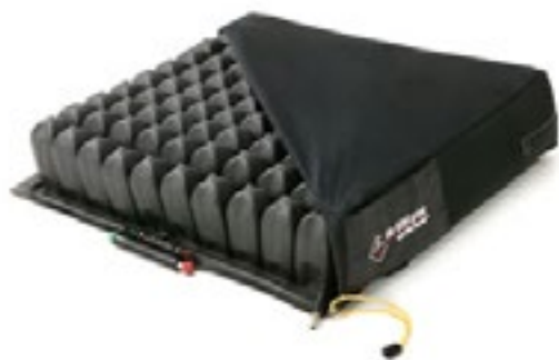
MR 6000 MedRite