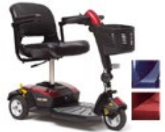
Código 3 ruedas S50LX 4 ruedas S54LX