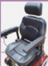
Asiento reclinable tipo automotriz