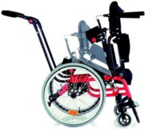
Código LCEV JUNIOR