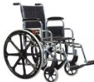
Con brazo corto Código 24040110