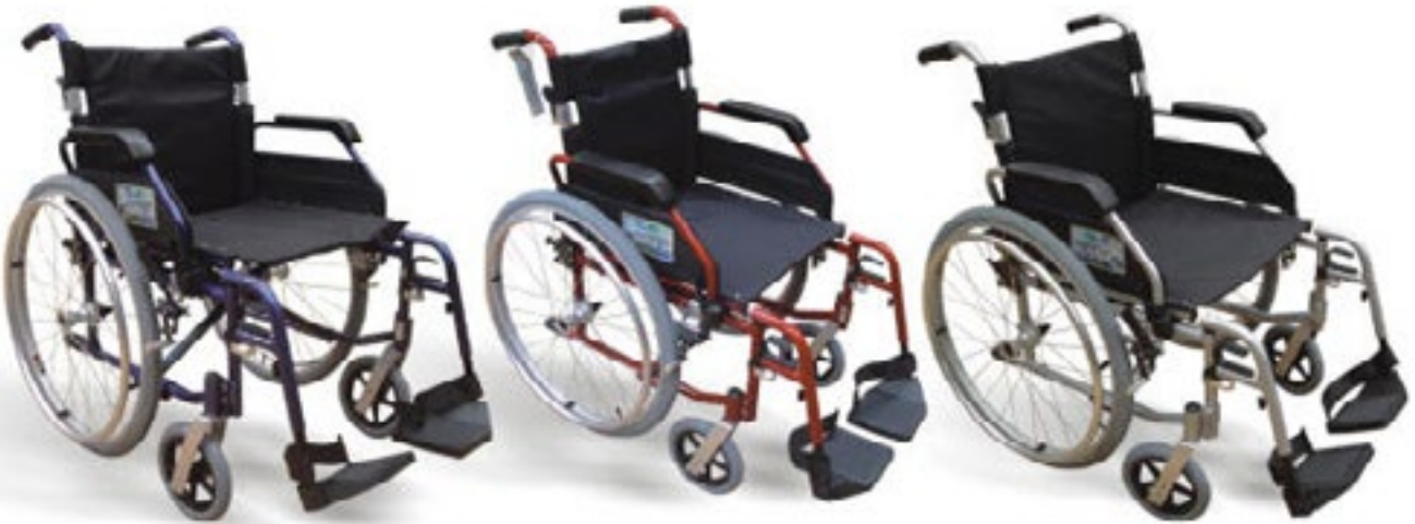
Silla de Ruedas de Aluminio Modelo R2000

Llantas desmontables convirtiéndose en Silla de Traslado 2 en 1 Código: 400-003-37-4