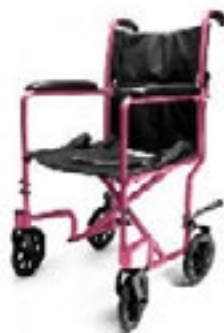
EJ787-1 ancho de asiento 43 cm color azul