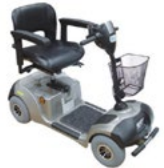
Plata Código R205 042 Modelo RE-SS4-P Azul Código R205 041 Modelo RE-SS4-A