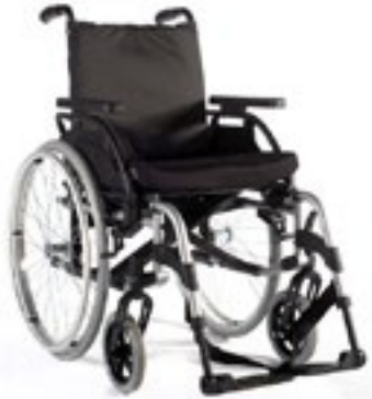
Modelo Breezy Basix