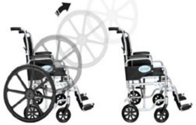
Silla de Ruedas marca DRIVE Modelo Pollywood

Llantas desmontables convirtiéndose en Silla de Traslado 2 en 1 Código: 400-003-37-4