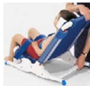
Ajustables en Altura

Mediante el ajuste de ambas piernas para que queden planos y mediante la colocación de asiento y respaldo en una posición horizontal, la silla Rifton Blue Wave se puede convertir en un baño abatible o silla de ducha muy fácil de transportar ocupando poco espacio