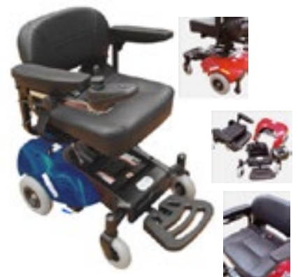
Roja Código R205082 Azul Código R205081