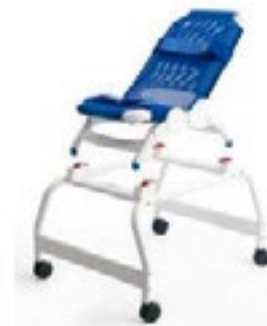
Soporte de Ducha

Este soporte es utilizado con cualquier tamaño de silla de ruedas, y levanta la silla de bañera a una altura conveniente para los traslados.