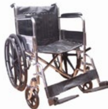
Silla de Ruedas marca DRIVE Modelo Marmoleada