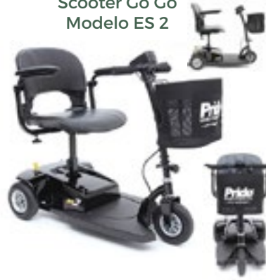
Scooter Go Go Modelo ES 2