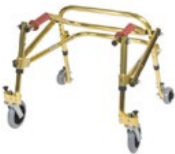
Código R201044 Mediana Código R 201043 Grande