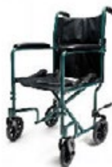
EJ788-1 ancho de asiento 48 cm color azul