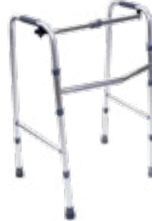
Andadera de aluminio ajustable reciproca