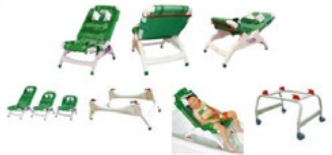
Base para silla tina Ducha con ruedas Wenzelite