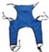
Arnés Cómodo con orificio para trasla- do de pacientes en Grúa hidráulica Código R208182