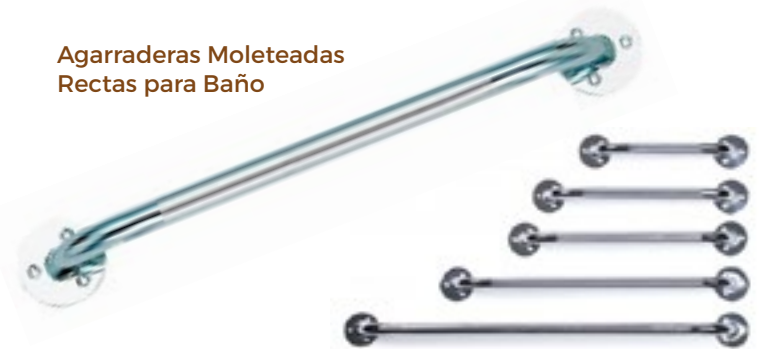
Disponibles en modelos de 12", 16", 18", 24" y 32"