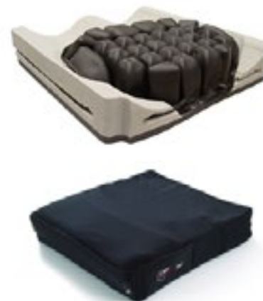
Cojín Hybrid Elite ROHO