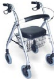
Código R201044 Mediana Código R 201043 Grande