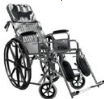
Silla de Ruedas Reclinable PCA Parálisis Cerebral para Adultos