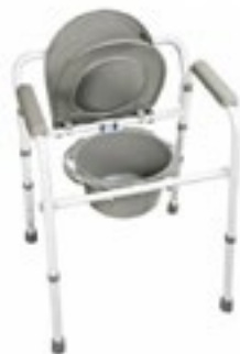
Silla Cómodo 3 en 1 Plegable Modelo 7108A