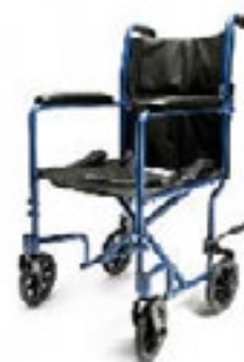
Silla de ruedas de traslado de acero