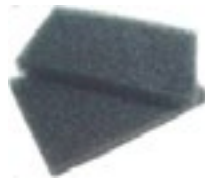
Filtro para Partículas