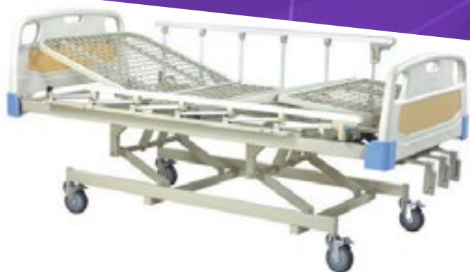
Cama para hospital manual de tres manivelas Código C3031