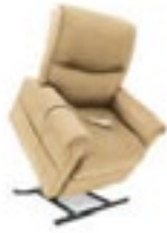
Sándalo Código LC105SC