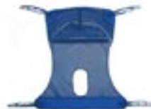
Arnés cómodo disponible con y sin orificio tipo Maya Código DSLR115