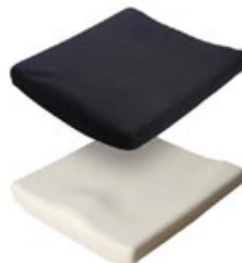
Cojín JAY Basic