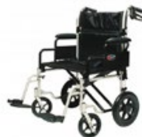
Código EJ 777-2