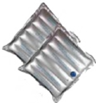
MR 6000 MedRite