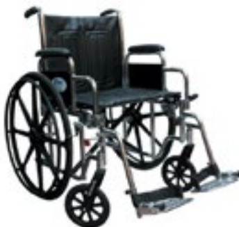
Silla de Ruedas para Pacien- tes Obesos hasta 150 kilos

Para pacientes con sobrepeso Código 400-001-14-4