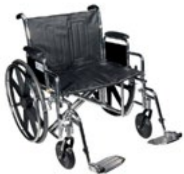
Silla de Ruedas Extra Grande marca Drive