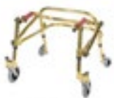
Extra Chico 400-002-85-4