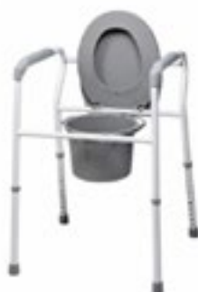
Silla Cómodo 3 en 1 Modelo 7103A