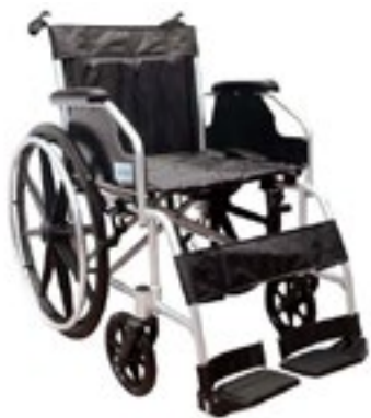
Silla de Ruedas de Aluminio Económica marca MEDICAL STORE