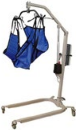
Código R208 181