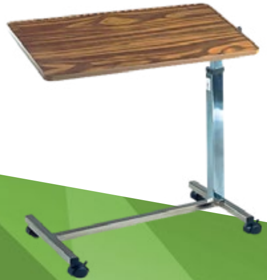
Mesa de alimentos Drive