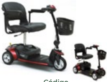
Código 3 ruedas SC40E 4 ruedas SC44E