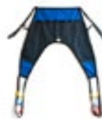
Asientos para Traslado de Lona Código ASL134