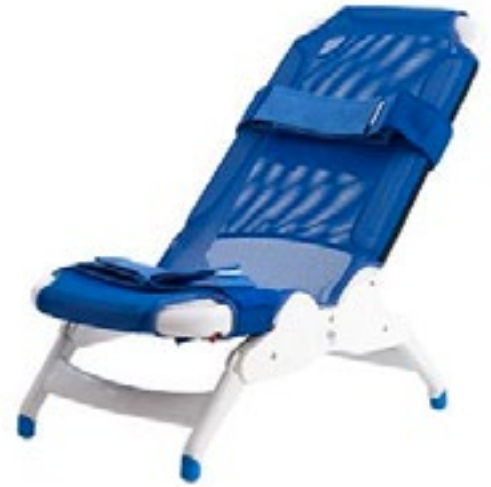
Código S-E41 / M-E42 / L-E43