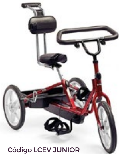
Código LCEV JUNIOR