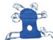
Arnés Cómodo con orificio para traslado de pacientes en Grúa hidráulica Código R208182