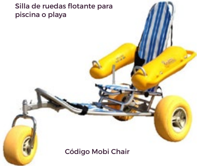
Código Mobi Chair