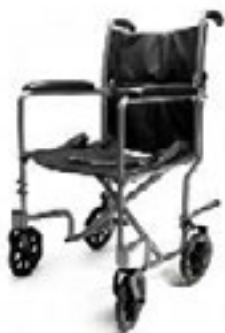
EJ783-1 ancho de asiento 43 cm color plata