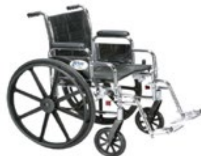
Silla de Ruedas para Pacien- tes Obesos hasta 150 kilos