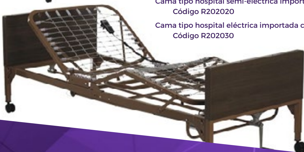
Cama tipo hospital eléctrica importada con ruedas Código R202030