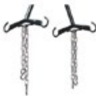
Juego de Cadenas para Arnés de Grúa de Pacientes Código GF133S-C