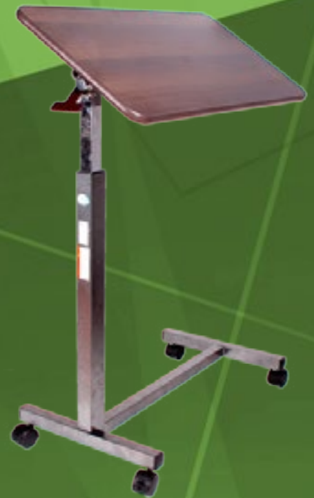
Mesa de alimentos reclinable ACTIV