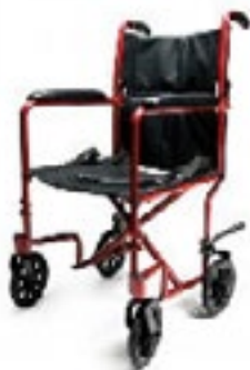
EJ781-1 ancho de asiento 43 cm color roja