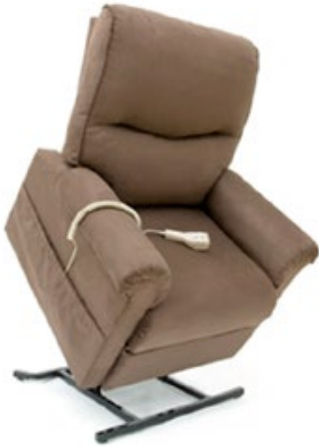
Cocoa Código LC105SC