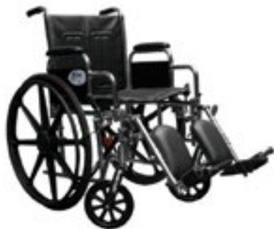
Silla de Ruedas Bariátrica de 18"

Para pacientes con sobrepeso Código 400-001-14-4