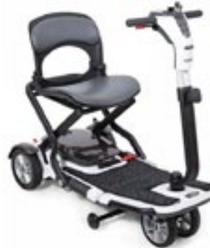
Código Go Go Scooter Folding S19