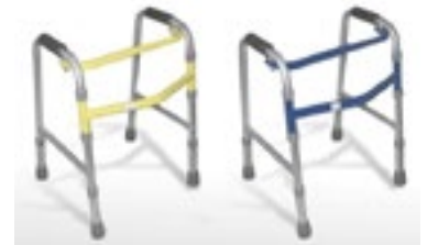
Azul sin ruedas R 100021 Azul con ruedas R 100023 Amarilla sin ruedas R 100022 Amarilla con ruedas R 100024