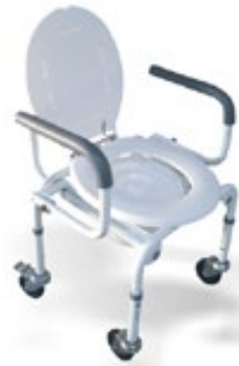
Código R 203039