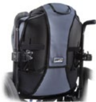
Respaldo Jay J3 para silla de ruedas