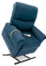
Azul Código LC105BC