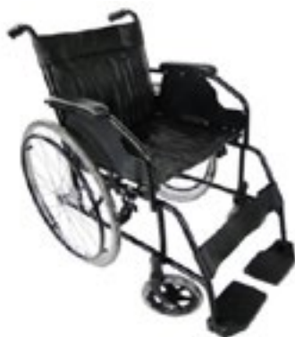
Silla de Ruedas marca MEDICAL STORE Modelo Doble Cero